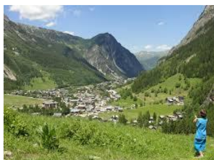
Votre station durant une semaine !