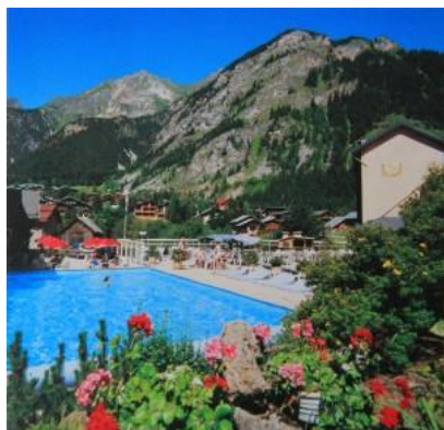
La piscine de l'hôtel et sa vue...

STAGE COMBINE A PRALOGNAN LA VANOISE - 2020