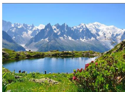
Venez découvrir un parc naturel de toute beauté !