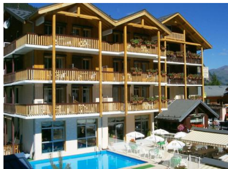
Hôtel du Grand Bec en été...

STAGE COMBINE A PRALOGNAN LA VANOISE - 2020