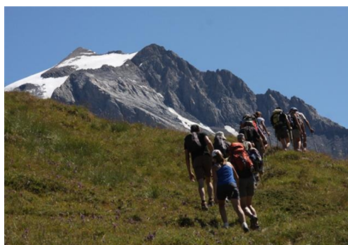
Un espace privilégié pour une balade et même une randonnée...